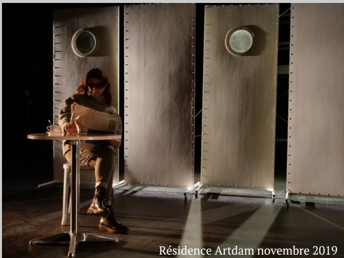
Résidence Artdam novembre 2019